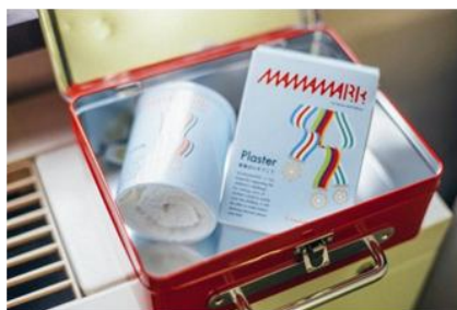
決勝は、自分たちで商品を作するなどレベルの高い戦いに。