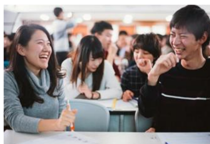
企画セミナーでは隣の人とのミニワークなどもあり、楽しく行われました。