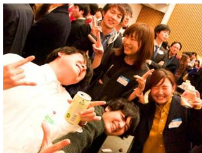
予選後の懇親会は競争の関係を越え参加者の交流が生まれました。