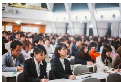
「学び」というテーマに、難しい表情を浮かべる参加者の皆さん。