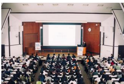
説明会の様子。東大の大教室にたくさんの方が集まりました。