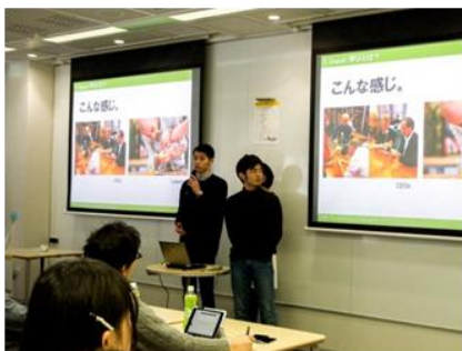
予選プレゼンテーションは総エントリー147 チームによる大プレゼン合戦に。