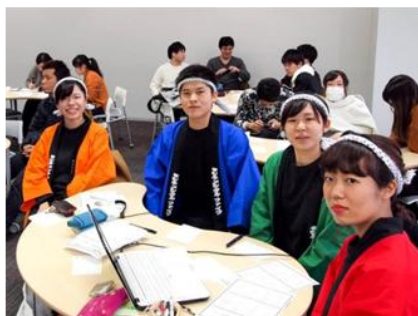
それぞれのチームが工夫を凝らし、自分たちの「学び」のブランドを紹介。