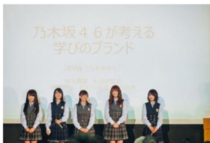
特別ゲストに乃木坂46も登場。彼女たちが考える学びのブランドも発表されました。