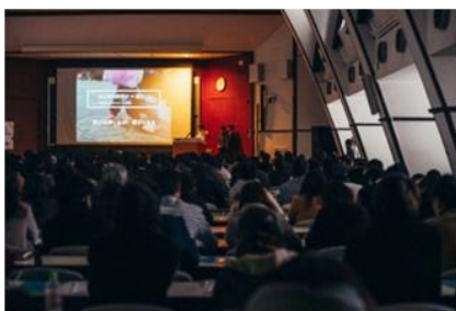
二次決勝の様子。上位4 チームによる公開プレゼンテーションが行われました。