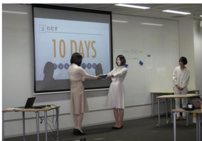
それぞれのチームが工夫を凝らし、自分たちのブランドを紹介。