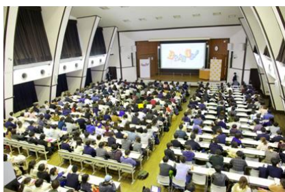
説明会の様子。東大の大教室にたくさんの参加者が集まりました。