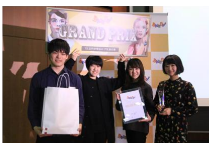
優勝した、atoi チーム。2 度目の挑戦での受賞でした。