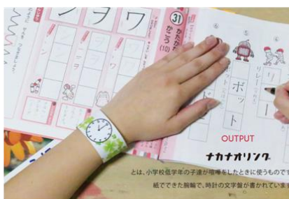
決勝は、自分たちでプロトタイプを制作するなどレベルの高い戦いに。