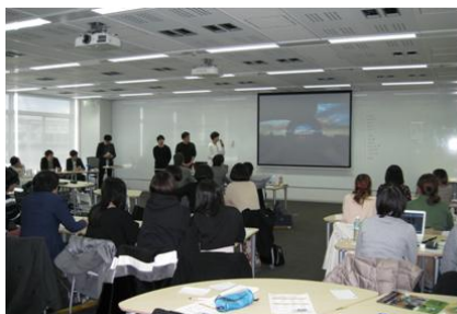
予選プレゼンテーションは 100 を超えるチームによる大プレゼン合戦に。