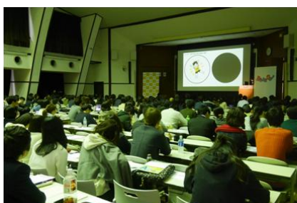
二次決勝の様子。上位 5 チームによる公開プレゼンテーションが行われました。