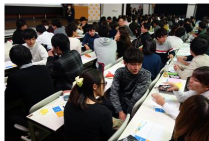
企画セミナーでは隣の人とのミニワークなどもあり、楽しく行われました。