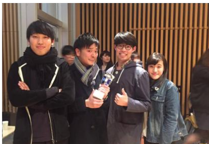
予選後の懇親会は競争の関係を越え参加者の交流が生まれました。