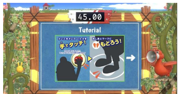
1問ごとにホームポジションへ戻るためスピーディな動きが必要