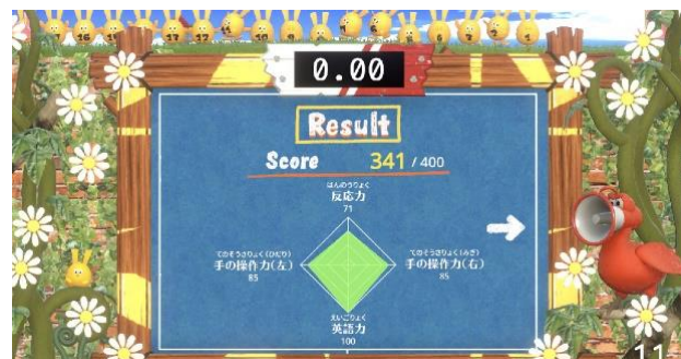
4指標による結果スコア。高得点だと画面のキャラが増加する仕掛けも

本アトラクションは2019年12月18日（水）より「リトルプラネット ららぽーと新三郷」（埼玉県三郷市）で稼働を開始し、2020年3月末までの期間限定で来場者に向けて展開していく予定です。