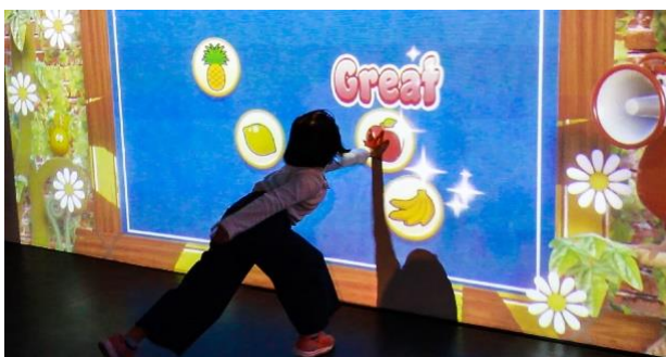
手の動きを測域センサーが感知し、スクリーンのアイコンが反応