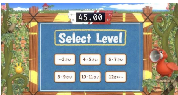
年齢にあわせて体験レベルを選択

体験レベルは「3歳以下」から「12歳以上」まで6段階が用意され、体験後には「反応力」「英語力」「手の操作力（左）」「手の操作力（右）」の4つの指標によるスコアが表示されます。家族や友達と比べてみたり、繰り返し挑戦してスコアアップを目指したり、遊び体験を通じて自然に英語と触れ合うことができます。